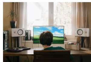
Présentation sur les jeux vidéo pour les professionnel·le·s du domaine social et les bénévoles (Noetic)