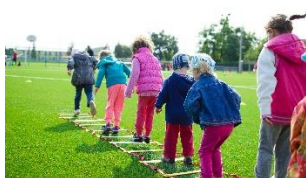
Rallye santé (REPER)

Le catalogue d'atelier comporte actuellement 6 activités, dont deux sont proposés par REPER et quatre par Noetic academy.