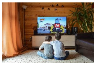
Atelier ABC (REPER)