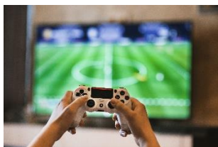
Initiation aux jeux vidéo pour les parents (Noetic)