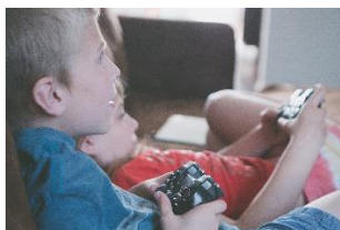
Introduction aux jeux vidéos pour les parents (Noetic)